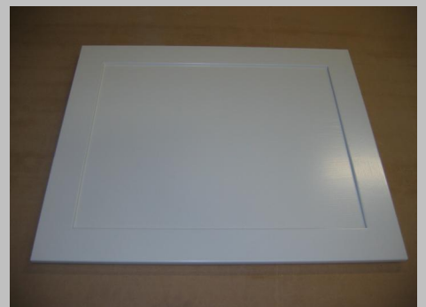
Færdig hvidmalet MDF låge.