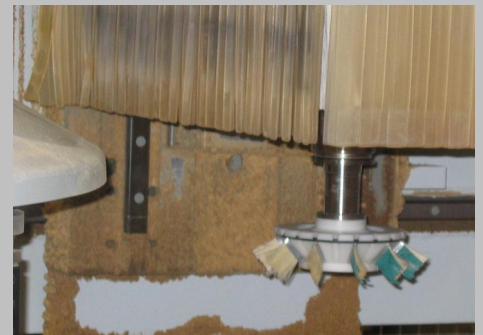
Pudseløsning på CNC maskine.