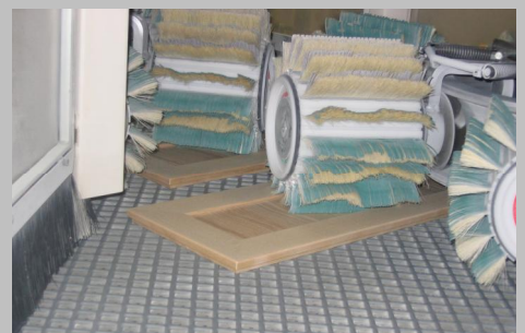
Børstepudser bestykket med Flex Trim pudsehoveder og slibestrips.