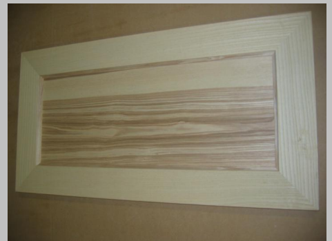
Slebet låge i asketræ uden brug af håndslibning.

- Overfladeslibning af profilerede døre i gennemløb