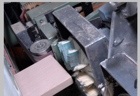
Emnerne, der skal profilslibes, kører hen forbi det roterende pudsehoved, hvis omdrejningstal er optimeret til båndhastigheden igennem dobbelttapperen og profilet.