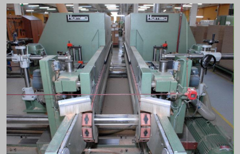
Denne dobbelttapper fik et Flex Trim pudsehoved påmonteret.