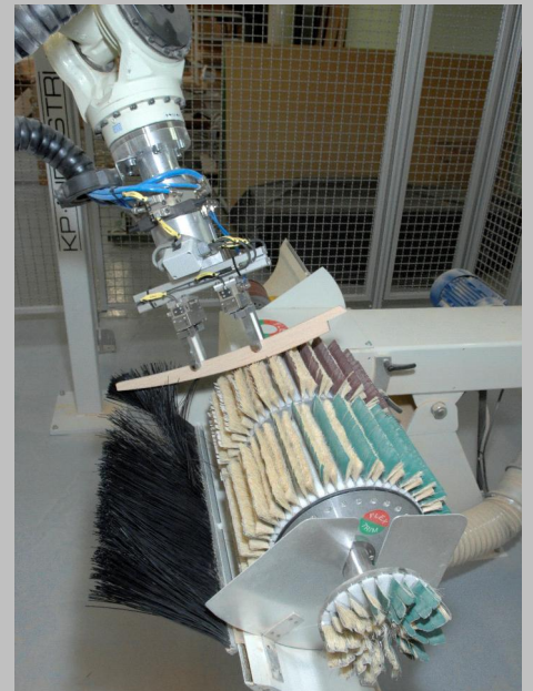
Flex Trims løsning er her monteret i en robotcelle.