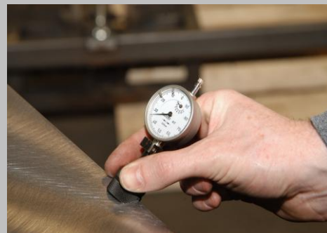
Stabil kant runding på 1,2mm - men større rundinger er også muligt.