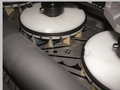
Hos Bogballe benyttes KOP hoveder.